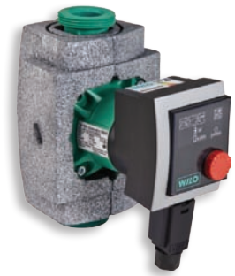
Abbildungsbildspiel Wilo-Stratos PICO, WILLO SE

Bei den Preisen handelt es sich um Bruttoangaben, welche die derzeit gültige MwSt. (zurzeit 19 %) beinhalten. Ohne Liefervertragsverhältnis bei den Stadtwerken steht Ihnen die Einmalzahlung offen. Bei vorzeitiger Beendigung des Liefervertrags werden noch offene Raten mit Vertragsende fällig.